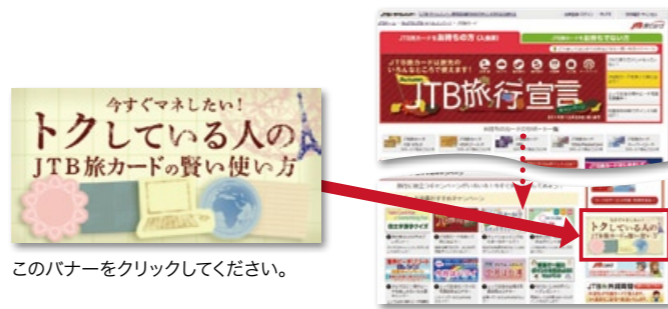
このバナーをクリックしてください。

上記MyJTB登録のSTEP④の後、「ポイント・JTB旅カード情報メルマガ」にマーク(レ点)が入っていることを確認してください。未チェックの場合には、マーク(レ点)を入れて、登録ボタンをクリックしてください。