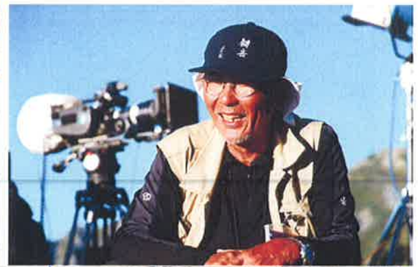
映画『劔岳 点の記』制作委員会 6月20日全国ロードショー

あの映画の舞台「劔岳」へ—— 6月20日(土)全国ロードショーの映画『劔岳 点の記』 の舞台となった富山県・立山へご案内いたします。