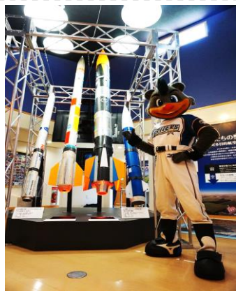
B★Bとモデルロケット【イメージ】