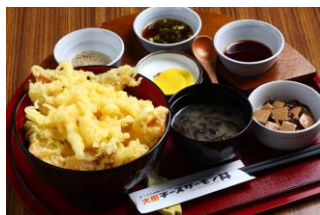
チーズサーモン丼 【イメージ】