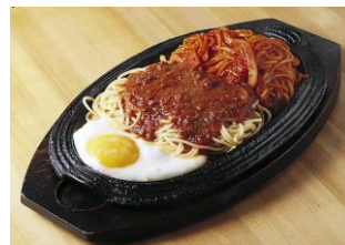
カツスパ 【イメージ】

企画協力：株式会社 北海道日本ハムファイターズ 旅行企画・実施：株式会社 JTB 北海道 大樹町