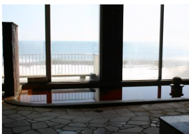
晩成温泉【イメージ】