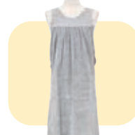
バスタイムワンピース