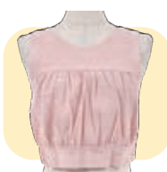
バスタイムトップス