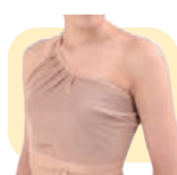
バスタイムカバー