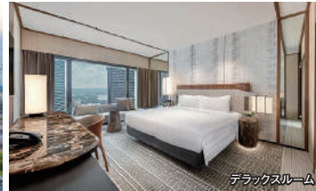
デラックスルーム

が取り消しをされたためにご参加のお客様が1人部屋の利用となった場合には、取り消しをされたお客様から取消料を申し受ける他、ご参加のお客様から1人部屋追加代金を申し受けます。