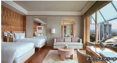
デラックススイート