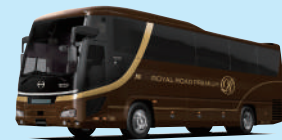
ロイヤルロード・プレミアム