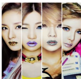
メイクアップ体験(イメージ)