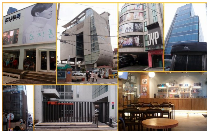
K-POPアイドル事務所散策(イメージ)