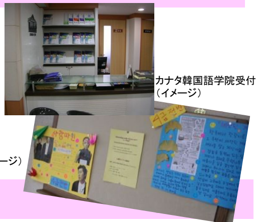
カナタ韓国語学院受付 (イメージ)

韓国語レッスンは、レベルに合わせて初心者の方でも興味を持って韓国語にふれることができるよう、ゲーム形式や日常会話中心の基本的なレッスンです。カナタ韓国語学院オリジナル教材を使い、簡単な英語やジェスチャーを交えながら、レッスンが行われますので、恥ずかしがらず、積極的に参加しましょう！午前中の韓国語レッスンでしっかり学び、午後のアクティビティで学んだ言葉を実際に使ってみると、より楽しく韓国語が身につくはずですよ。