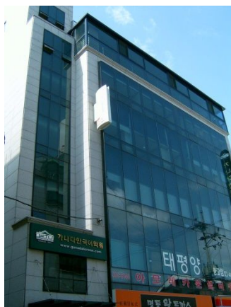
カナタ韓国語学院外観(イメージ)