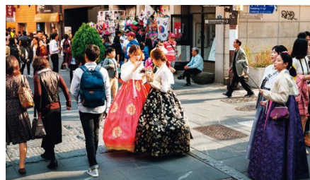
チマ・チョゴリ着付け体験(イメージ)