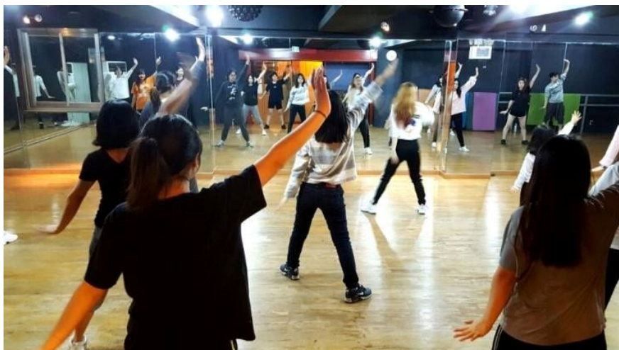
K-POPダンスレッスン (イメージ)