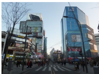
新村の街(イメージ)