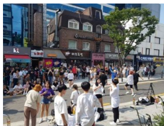
弘大周辺の街(イメージ)