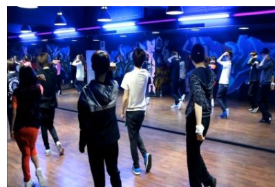
K-POPダンスレッスン(イメージ)

午前中の韓国語レッスンの後、午後から様々なアクティビティを体験します！日本でも大人気のK-POPダンス体験をはじめ、チマ・チョゴリの着付け体験や景福宮・三清洞散策、テレビ局MBC見学やメイクアップ体験レッスン、K-POP芸能事務所散策など盛りだくさん！もちろん見学をするだけでなく、韓国のマナーや文化、習慣を学びながら体験する時間になっています。たくさんのアクティビティ体験を通じて、実際に韓国を感じてみましょう！