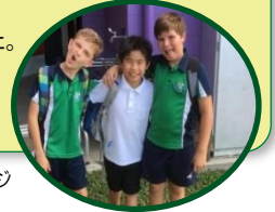
★クラスメートとイメージ

今回、初めて海外親子留学に参加しました。学校初日は現地スタッフの方と登校し、校内を案内して、先生方を紹介して頂きました。子供たちは大変不安そうでしたが、コンドミニアムに帰ってくると、英語があまり話せなかったけれど、楽しかった、という言葉も聞けてとても安心しました。短期間の留学でしたが、とても貴重な体験ができました。