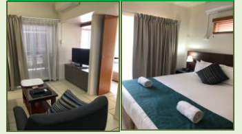
★1ベッドルーム室内/イメージ

ケアンズショッピングセンター近くにあり、プール、ジム、バーベキューエリアなどもあります。1～2ベッドルームまで手配可能です。