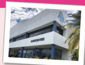
★学校外観/イメージ

世界各国から集まる生徒たちと、国際的な雰囲気の中で、学びます。英語初心者でも、フレンドリーな学校スタッフがサポートしてくれます。日本人スタッフもいて安心です。