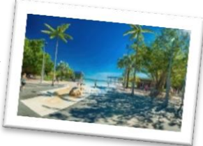
★ケアンズ市内/イメージ

ケアンズは世界最大のサンゴ礁地帯として名高いグレート・バリア・リーフへの玄関口で、リゾート客や観光客でいつも賑わっています。高原列車や世界最古の熱帯雨林など見所がたくさんあります。人も町ものんびりとして、リラックスした雰囲気が味わえます。