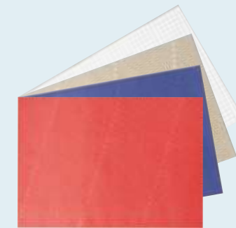
包装紙(無料) カラー/赤・青・金・シルバー(弔専用)