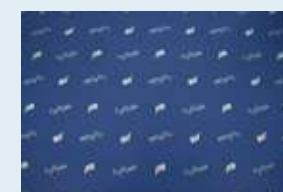
オリジナル包装紙(無料)