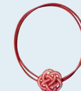
水引ゴム(1個165円(税込)) ※ボックスタイプ・桐箱用