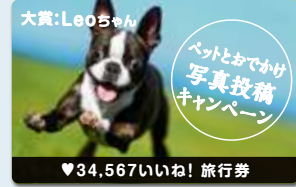
消費者キャンペーン(例)