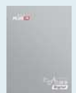
オリジナル紙箱(有料)