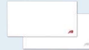
専用ケース(無料) ロゴカラー/赤・シルバー(弔専用)