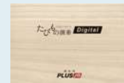
オリジナル木箱(有料)