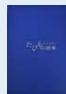
オリジナル化粧箱(無料)