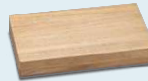
桐箱(1箱440円(税込)) ※桐箱は包装はいたしません。包装をご希望の場合は、JTBグループ販売店のスタッフにお伝えください。