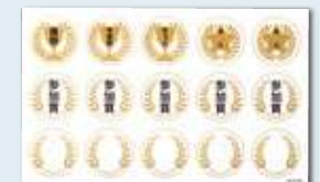
競技用シール(無料)