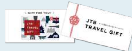
JTBトラベルギフト台紙(無料)