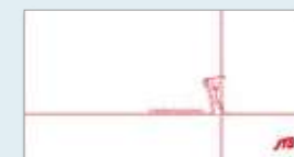
ゴルフ用封筒(無料)