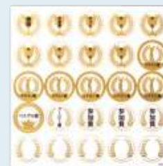
ゴルフ用シール(無料)