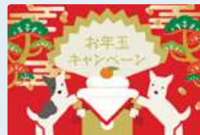
オリジナルデザイン券面(例)

■テンプレートデザイン(無料) お持ちの画像、またはQUOカードPayのテンプレートにメッセージを添え、券面をデザインできます。