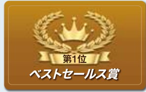
セールスコンテスト(例)