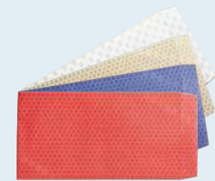
包装紙(封筒タイプ)(無料) カラー/赤・青・金・シルバー(弔専用)