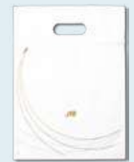
ポリ手提げ袋(無料)