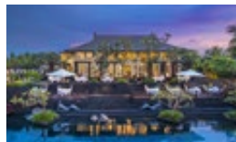
ウエディングメニューA(カップル分)