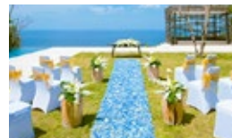
フラワーバージンロード