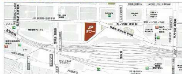
このマップは参考イメージです。立地や大きさなど実際と異なる場合があります。