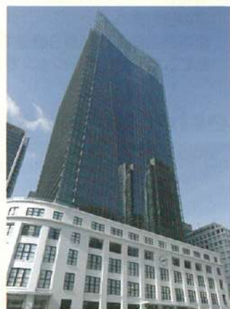
▲東京駅前丸の内エリアの新しいランドマーク。 東京シティアイはJPタワー1階・地下1階です。