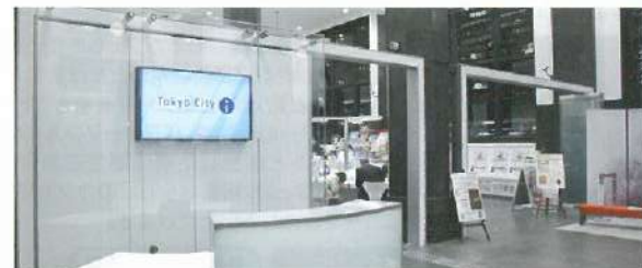
▲東京シティアイ1階