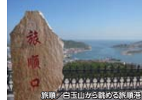
旅順/白玉山から眺める旅順港

大連の南に位置する軍港都市、旅順、日露戦争の激戦地として知られる街の見どころを1日かけてじっくりとご案内します。