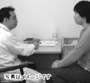
写真イメージです