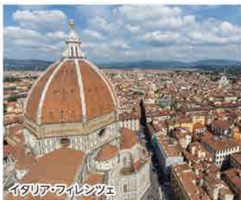
イタリア・フィレンツェ