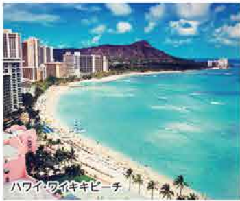
ハワイ・ワイキキビーチ