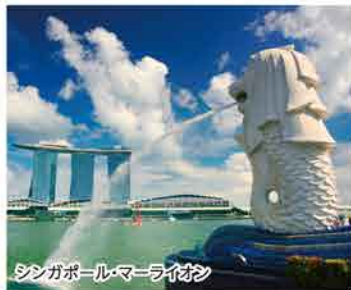
シンガポール・マーライオン