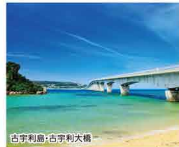
古宇利島・古宇利大橋