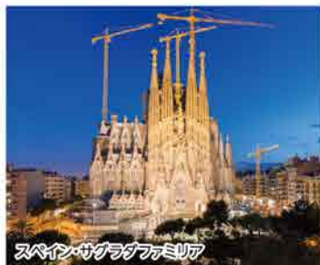
スペイン・サグラダファミリア