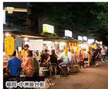
福岡・中洲屋台街