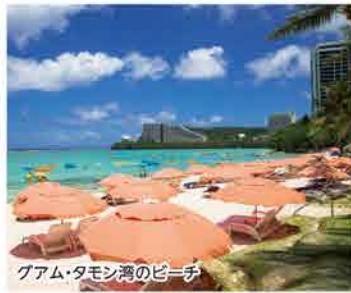
グアム・タモン湾のビーチ