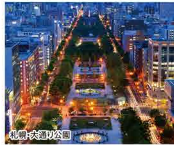
札幌・大通り公園